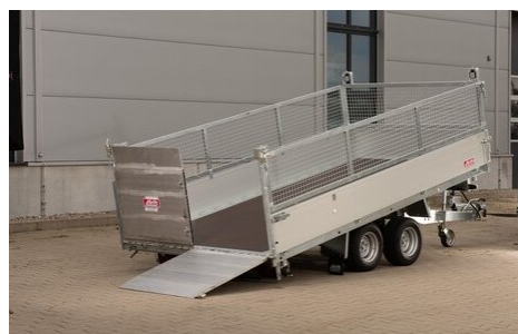
Multifunktionsrampe mit Dreh- Klappfunktion und möglich mit Pendelfunktion als Sonderausstattung