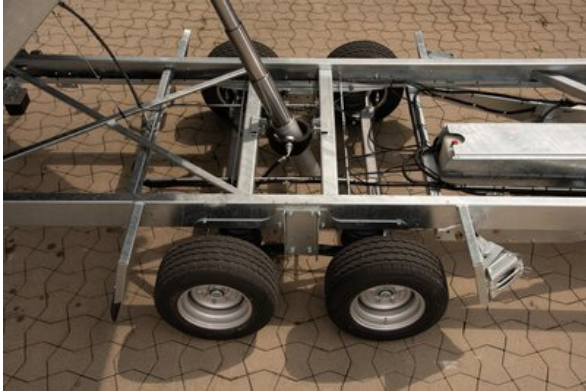
Geschweißte verwindungssteife Rahmenkonstruktion, feuerverzinkt Groß dimensionierter Kippzylinder