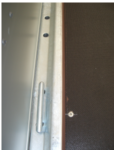
Zurrbügel ausziehbar, im Vielloch-Außenrahmen mit Federniederhalter