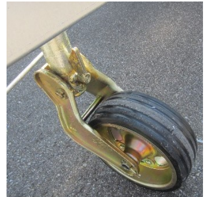
Schwerlaststützrad 500 kg breite Rolle 230x80